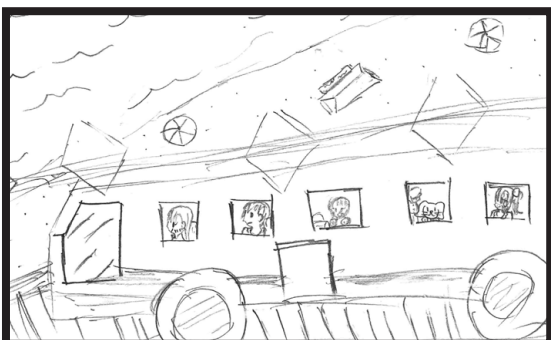
中西 菜 (9才) 『旅行うれしいな!』