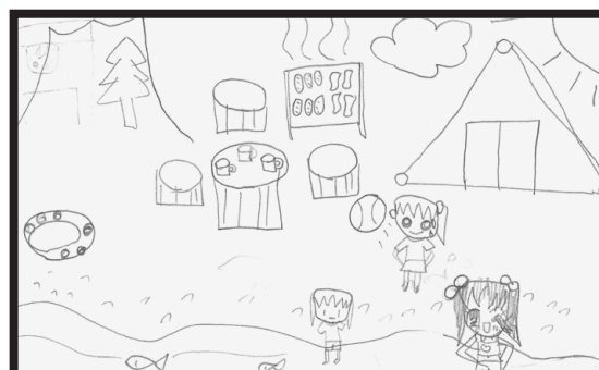
犬飼 日奈子 (10才) 『キャンプ』