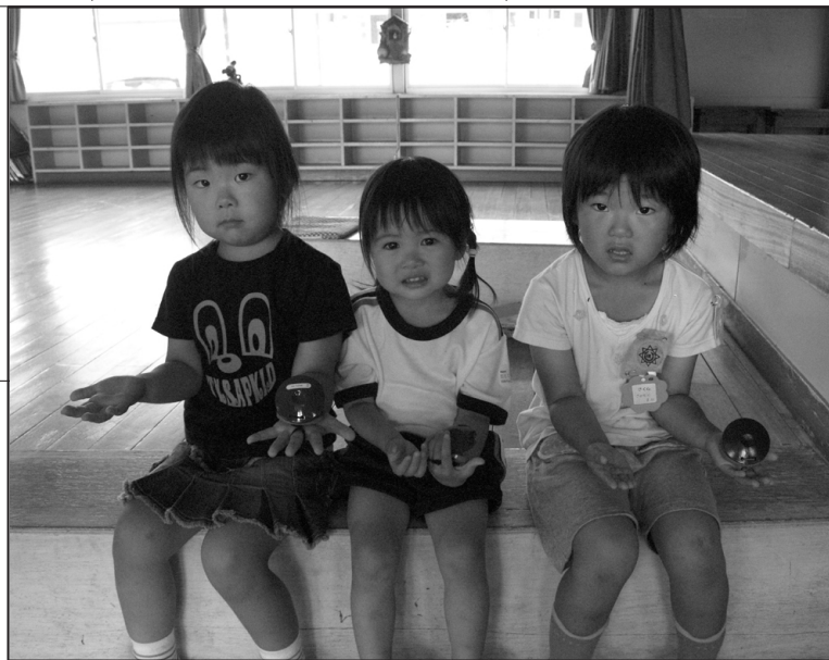
広畑保育園のグループレッスン風景

なそんな気がします。 どみそ音楽教室では、TV 番組の収録を含めた様々な 行事を計画し、夏休みの子供